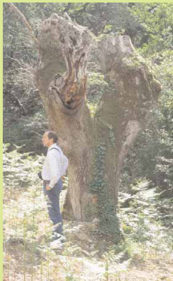
Photo 2. Tentative de "déménagement" de ces niches écologiques. Mais le résultat laisse sceptiques les spécialistes (Guy Lemperière).