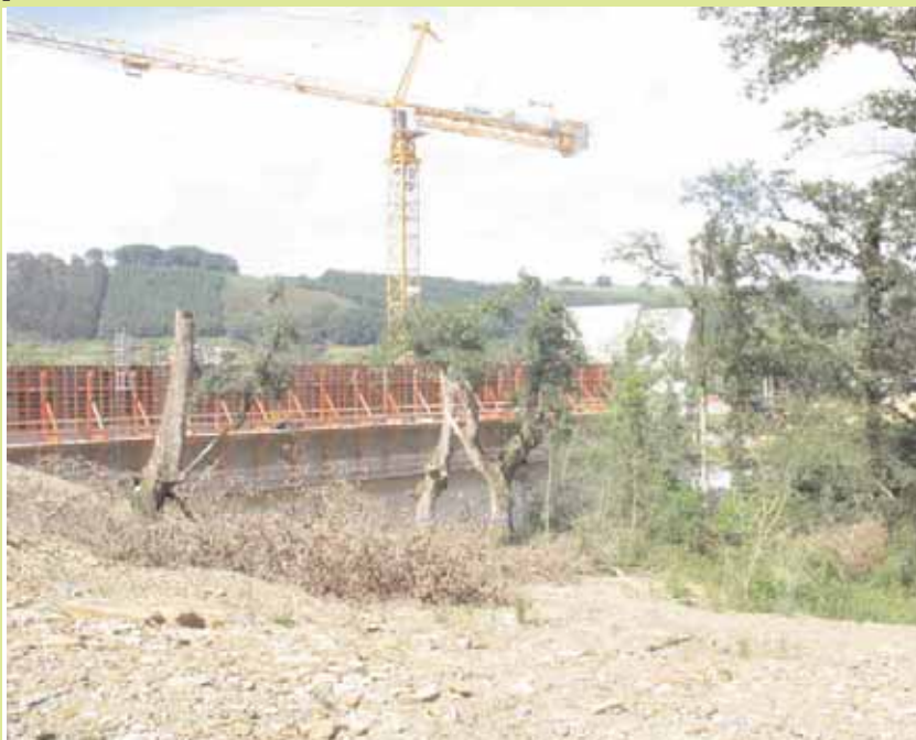
Photo 1. Barrage en construction. Un investissement de taille, pour une mise en sécurité de zones inondables à fort potentiel de développement urbain. Mais n'aurait-il pas été plus simple de déplacer la cible ?