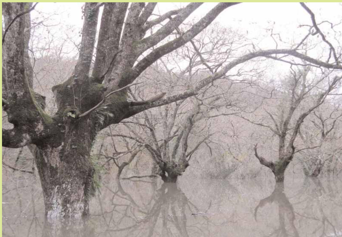
Photo 3. Résultat, un scénario catastrophe. Après "Massacre à la tronçonneuse" voici "Titanic," en direct sans trucage. Les bateaux coulent, les naufragés avec.

Conclusion, mettre autant de moyen pour détruire un patrimoine d'une telle richesse laisse à espérer que l'opinion publique aura réellement pris la mesure des pertes engagées. Quand à l'arboriste, cette zone était l'une des toutes dernières Ecole de l'Arbre à cette échelle. C'est une perte inestimable qui se passe de tout autre commentaire.