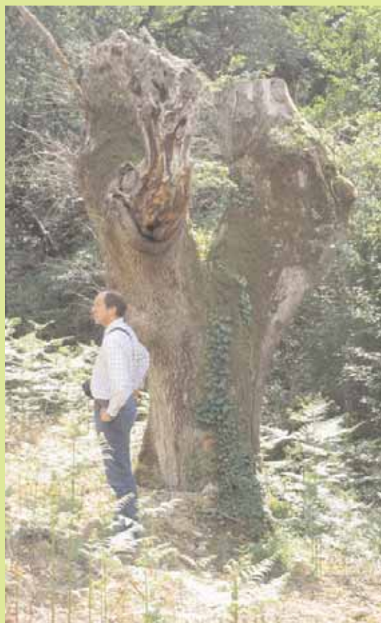
Photo 2. Tentative de "déménagement" de ces niches écologiques. Mais le résultat laisse sceptiques les spécialistes (Guy Lemperière).